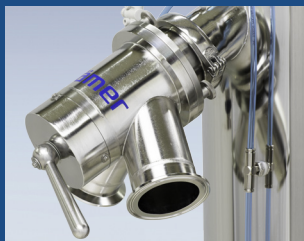
无需工具安装和附加的支撑