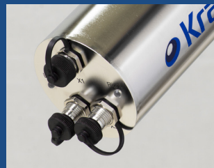
选装件: 料位和堵塞传感器接口