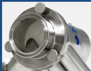
TC 入口转接器品种的不同规格