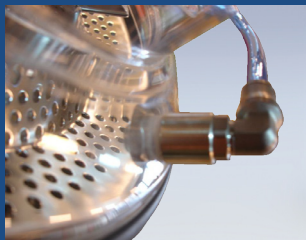
Luftstrom-System für optimale Entstaubung