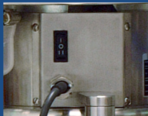
Einfache Bedienung mittels Kippschalter