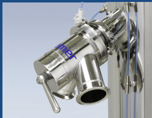
Option: Produkt-Verteiler KV2010