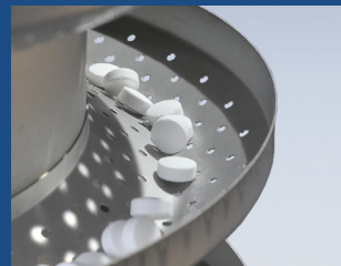
Option: Diverse Wendel-Oberflächen auf Anfrage erhältlich