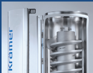
Schwenk- und entfernbares Sichtfenster